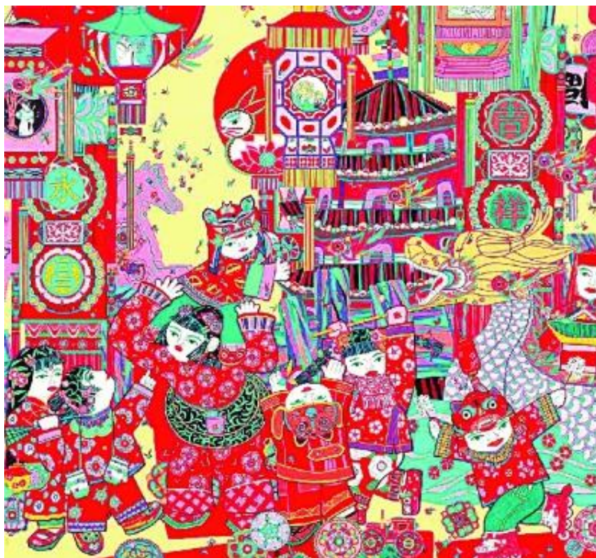
吉祥钱塘（年画） 朱松

春节将至，作为“年文化”的一部分，以火红的春联、福字、剪纸以及多彩的年画、邮票为代表的各种美术作品开始行时，书画家们纷纷展纸挥毫，带火了迎春的气氛，映红了人们的心境，也装点了冬春之交的日子。